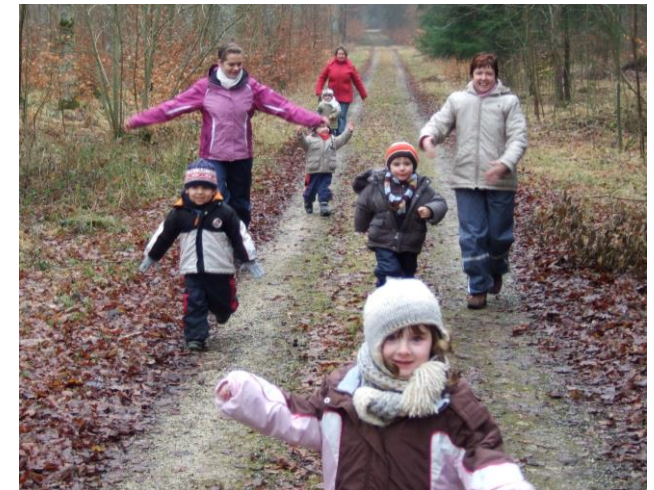
Bewegung im Alltag, ein Schwerpunkt des Naturprofils